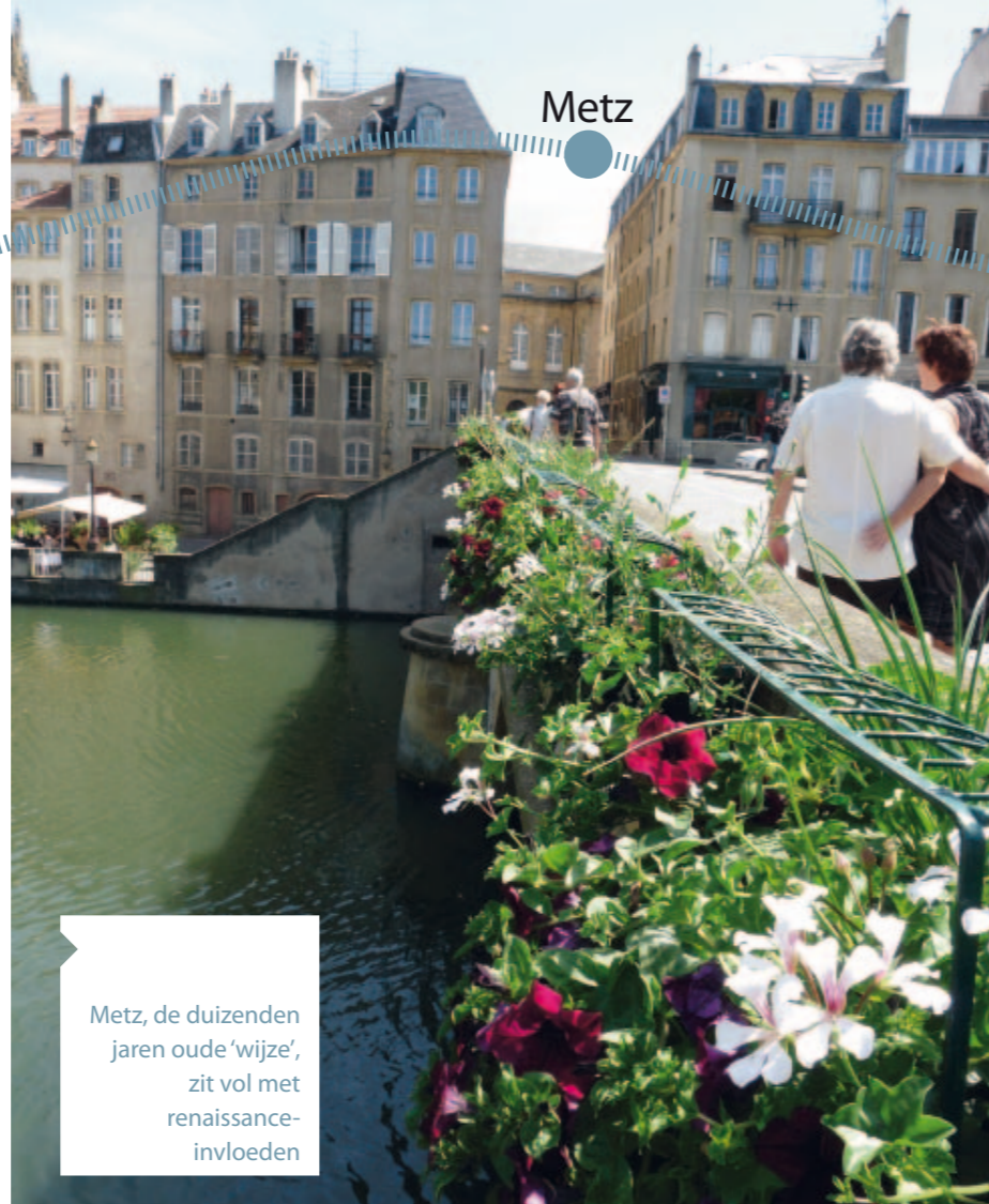
Metz, de duizenden jaren oude 'wijze', zit vol met renaissance-invloeden

Verlaat de Lorraine niet zonder de beroemde Munster te proeven. Hoe ouder, hoe heftiger de smaak en geur. In streekrestaurants wordt de Munster geserveerd als digestief met karwijzaadjes, die kruidig en komijnachtig smaken.