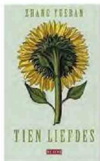
TIEN LIEFDES, ZHANG YUERAN, DE GEUS

Een zonnebloem wordt verliefd op de schilder Vincent van Gogh, een bruid in spe krijgt bezoek van haar dode jeugdvriendje. In deze bijzondere liefdesverhalen houdt Zhang Yueran vrouwen een spiegel voor: hoever willen ze gaan voor de liefde? Is het niet beter de touwtjes over je leven zelf in handen te houden dan je te onderwerpen aan je geliefde of familie? Deze bundel biedt een verfrissende kennismaking met een van China's bekendste schrijfsters.