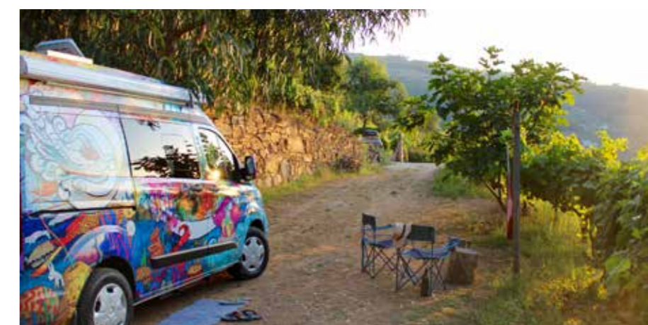
Camping Quinta Corujeira