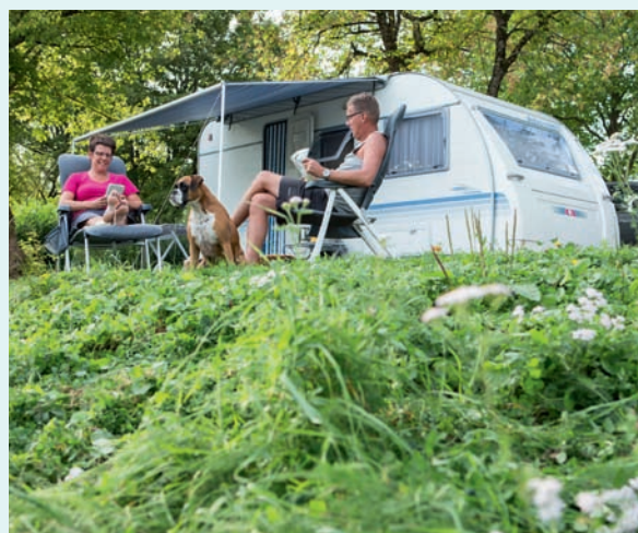
↑ Camping Lac de la Liez

adres Rue de la Croix Badeau 6 F-10200 Soulaines-Dhuys t (0033) 32527 0543 i www.croix-badeau.com , www.anwbcamping.nl/76820 gps 48.37671, 4.73820 open 1 april t/m 30 september terrein 12 ha, 41 kampeerplaatsen, 1 stacaravan en 2 toercaravans