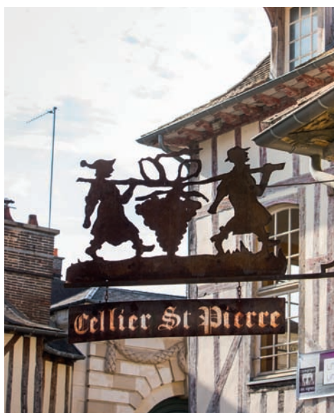
↑ Chique winkel voor goede wijn in Troyes

Het we-gaan-nog-niet-naar-huis-gevoel wordt niet minder van al die verhalen. Zeker niet als we horen dat er verder noordwaarts nóg een meer ligt dat je echt niet mag missen: Lac du Der, het grootste stuwmeer van Europa. Het meer is in 1974 aangelegd om het water dat door de Marne stroomt te reguleren. De aanleg van het Lac du Der was nodig om ervoor te zorgen dat enerzijds het water in Parijs niet te hoog kwam en dat anderzijds er daar steeds genoeg water door de Seine stroomt. Je kunt er 48 vierkante kilometer fietsen, wandelen, bootje varen. En ja hoor, mét campings in de buurt. Nou, vooruit. Maar daarna: écht naar huis. ●